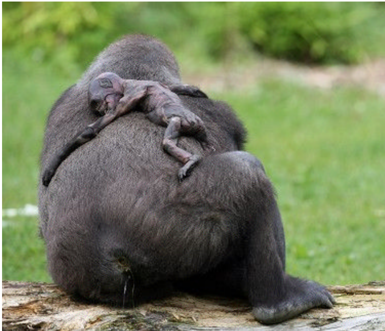
Gorilla-Mutter "Gana" trauerte im August 2008 um ihr Baby namens Claudio. Sie trug das Kind tagelang mit sich herum