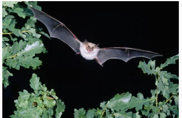
Fledermäuse haben die feinsten Ohren in der Tierwelt und fangen selbst in völliger Dunkelheit ihre Beute. Sie können kleinste Insekten allein über ihren Flügelschlag aufspüren. Dazu benutzen sie die Echoortung.

Vor zwei Wochen veröffentlichten amerikanische Forscher die bisher größte Studie zum Totenkult unserer nächsten biologischen Verwandten, den Primaten. Die Untersuchung stützt sich auf drei Jahre Beobachtung einer Herde Paviane im kalten äthiopischen Hochland – und deren Abschiedsschmerz. Danach verglichen sie