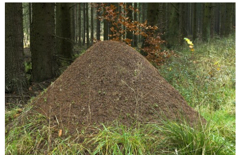
Sinnend verharren Deutsche (nicht im Bild) bei ihren Waldspaziergängen vor Ameisenhaufen

Diese Woche war Welttierschutztag. Man muss daran erinnern, denn der Welttierschutztag steht seit 20 Jahren im Schatten des Tages der deutschen Einheit. Am 3. Oktober feiern die Deutschen die Wiedervereinigung. Am Tag darauf sind sie erschöpft und finden keine Kraft mehr, sich um das Wohl der Tiere zu kümmern.